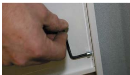
2. Efterdra insexskruvarna för att stabilisera stativet